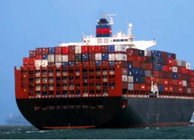
Ingersoll Rand 压缩机应用于全球的货运船舶及游艇。

必须保留对所有进口/出口交易的记录，包括但不限于购买订单、合同、发票及付款记录。国际贸易规则很复杂。若有任何疑问，请联系当地管理人员或合规部。