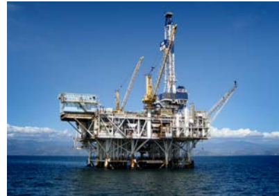
Ingersoll Rand 的压缩机和泵用于石油和天然气开采。

Ingersoll Rand 通过不断开发满足客户需求的创新、高质量的产品来维持客户的忠诚度。我们的目标是使我们的所有产品和品牌都能获得最高的客户满意度。