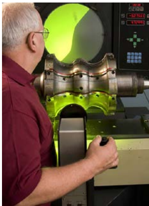
Ingersoll Rand 质量保证部门利用最新的技术测试用于生产我们的 Sutorbilt Legend 转子的工具。