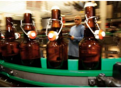
Ingersoll Rand 的压缩机可用于全球的酿酒和装瓶业务。